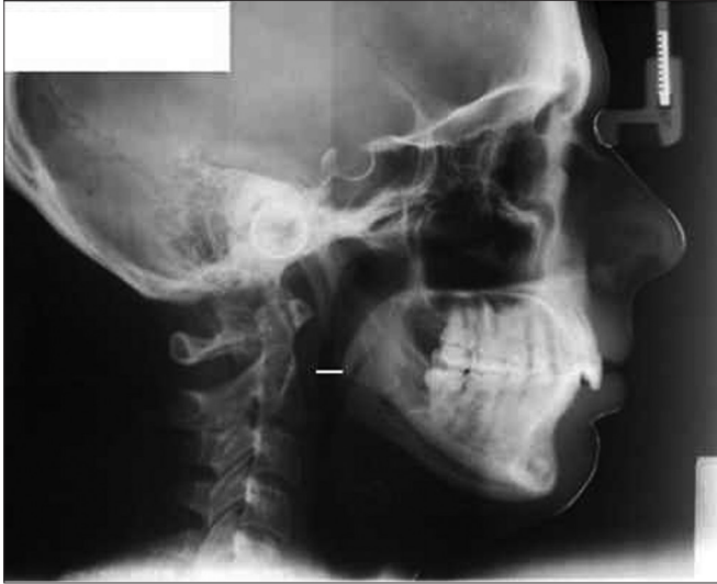
Figura 1. Medida cefalométrica PAS (via aérea inferior): largura da faringe no ponto onde, radiograficamente, a borda posterior da língua cruza com a borda inferior da mandíbula até o ponto mais próximo da parede posterior da faringe.

Foram selecionadas 20 telerradiografias laterais de 20 pacientes com diagnóstico clínico de deglutição atípica e 20 telerradiografias laterais de 20 pacientes com diagnóstico clínico de deglutição normal. Com estas telerradiografias, realizou-se estudo piloto para cálculo de tamanho amostral: calculou-se o desvio padrão do grupo controle e a diferença entre as médias dos grupos controle e experimental. Com nível de significância de 0,05 e poder do teste de 0,10, obteve-se que o tamanho amostral desejado é de 110 telerradiografias, 55 de cada grupo. Tendo sido realizado o cálculo de tamanho amostral, procedeu-se à seleção da amostra nos mesmos critérios que o estudo piloto, descrito anteriormente.