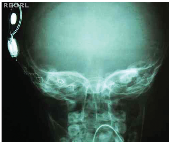
Figura 4. Resultado radiológico esperado (AP Transorbitária).