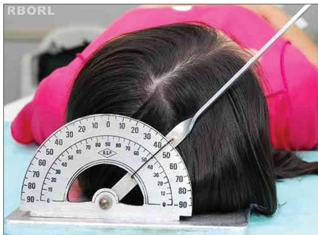
Figura 5. Posicionamento - plano sagital mediano em 45° com a horizontal: Oblíqua lateral (vista posterior).

* Se necessário, utilizar calços radiotransparentes para assegurar que não haja movimentação durante o disparo.