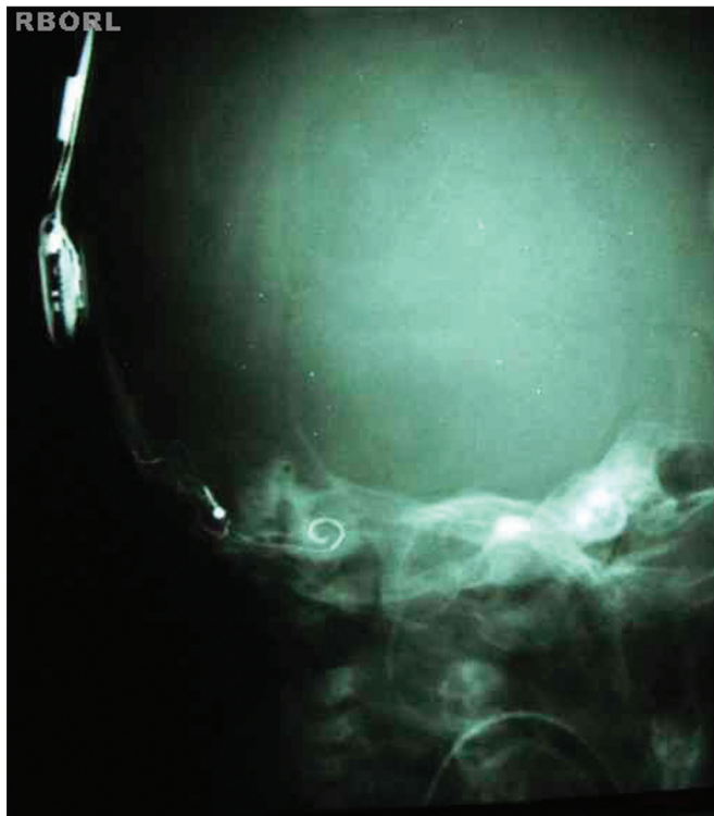
Figura 7. Resultado radiológico esperado (Oblíqua lateral 45°).

Densidade e contraste adequados permitirão a visualização do implante em toda sua extensão, bem como das estruturas dentro do labirinto ósseo. Margens ósseas nítidas evidenciam ausência de movimento (Figuras 7 e 8).