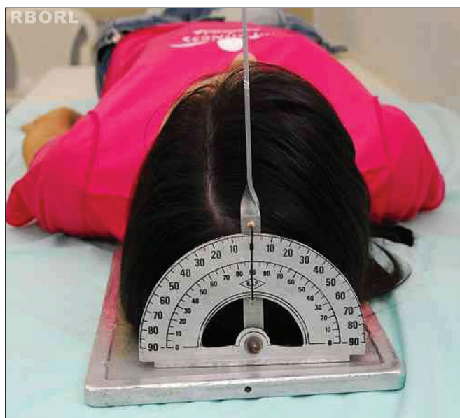
Figura 1. Posicionamento - plano sagital mediano em 90° com a horizontal: Transorbitária (vista posterior).

Com o paciente em decúbito dorsal, o chassi é colocado sob a cabeça, alinhando o plano sagital mediano em 90° com o plano horizontal, assegurando que não haja rotação e/ou inclinação da cabeça (Figura 1).