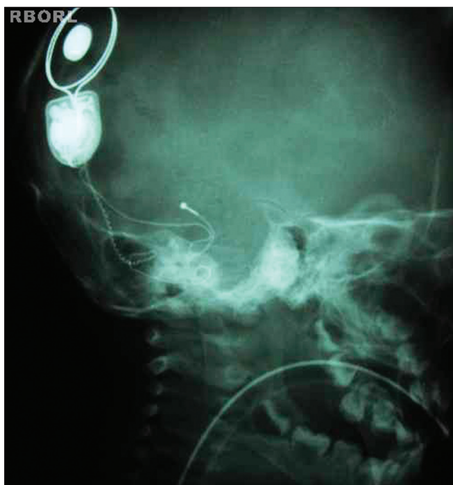
Figura 8. Resultado radiológico esperado (Oblíqua lateral 45°).