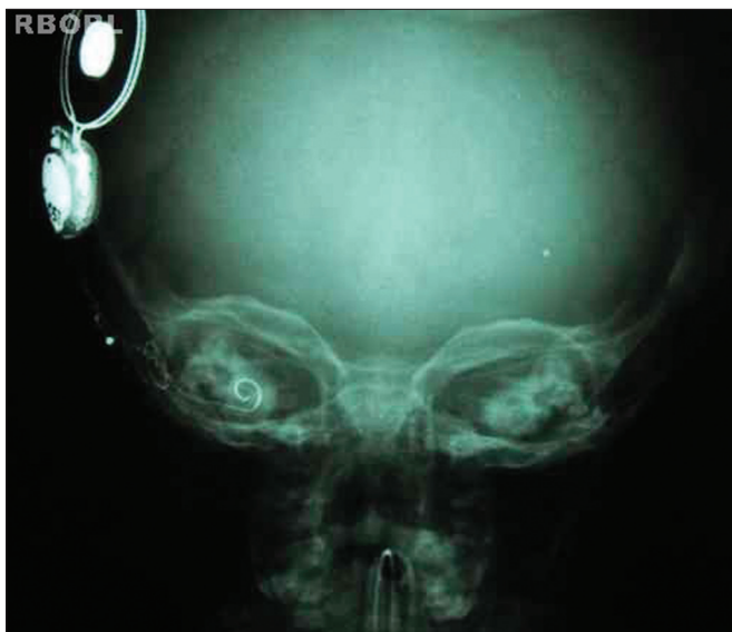
Figura 3. Resultado radiológico esperado (AP Transorbitária).