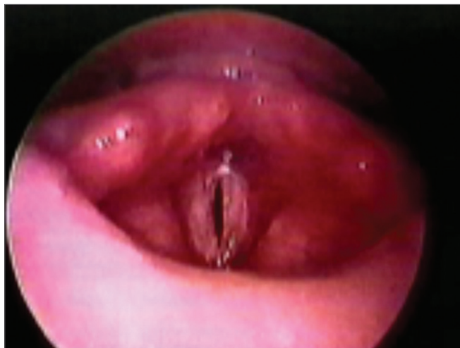
Figura 1. EGP grau III.

Em oito (47%) pacientes com EGP, foi inicialmente usada a técnica do “microtrapdoor flap” (Figura 2), originalmente descrita por Dedo & Sooy 10 , a qual permite uma incisão na superfície superior da estenose, dissecação submucosa usando laser de CO 2 , criação de um “flap” mucoso bipediculado lateralmente, com remoção da cicatriz subjacente. Em oito (47%) pacientes, usamos uma variação da técnica do “microtrapdoor flap”, fazendo