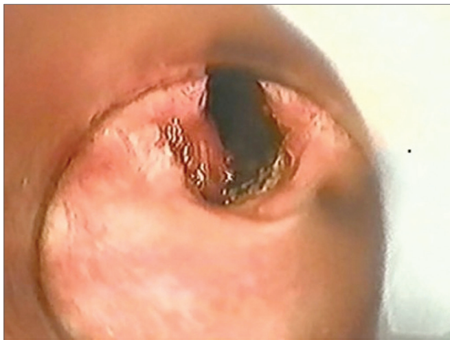
Figura 2. "Microtrapdoor flap" unilateral: EGP grau III.

adelgado e recolocado sobre a superfície cruenta de um lado, sendo fixada com gel de fibrina no local (Tissucol®). Esta técnica foi chamada "microtrapdoor flap" unilateral.