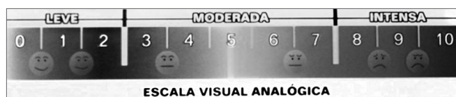
Figura 3. Escala Visual Analógica utilizada por obstrução nasal.

tes especificações: 1) Aclimação - participante sentado por 20 minutos no ambiente do teste. Nesse período, o questionário foi preenchido e o exame físico realizado; 2) O participante preencheu a escala visual analógica (EVA) em relação à obstrução nasal (Figura 3); 3) Foi realizada a mensuração do PFNI no participante, três vezes consecutivas com intervalo de 1 minuto entre elas 4,6 . A técnica para realização do exame consistiu em mensurar o fluxo inspiratório nasal no participante, em posição ortostática, com aparelho acoplado na região anterior do nariz por uma pequena máscara ligada a um cilindro plástico por onde passa o ar na inspiração forçada. A obtenção do resultado é imediata, semelhante ao já conhecido peak flow expiratório utilizado rotineiramente na Pneumologia para pesquisa de capacidade expiratória pulmonar.