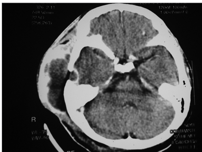
Figura 3. TC de mastóides com aumento de partes moles cística na região temporal direita com captação periférica de contraste, lesão lítica temporal à direita com captação de contraste da dura-máter subjacente.

Realizada intervenção cirúrgica com abordagem retroauricular sendo encontrada secreção espessa esverdeada, grande área de necrose tecidual, erosão óssea com exposição da dura-máter que se encontrava íntegra. Realizada drenagem e limpeza local. Enviado material para exame microbiológico e histopatológico.