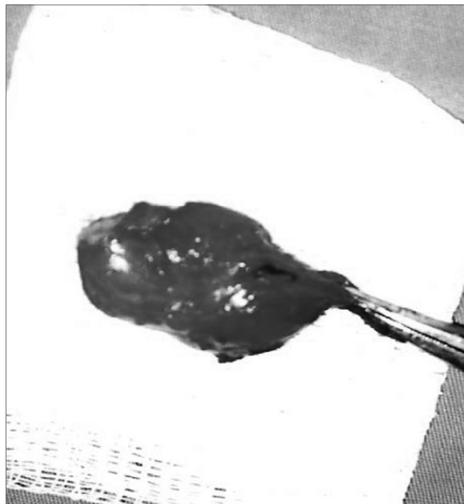
Figura 6. Peça cirúrgica.