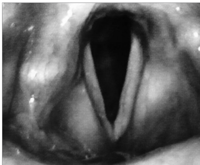
Figura 7. Videolaringoscopia pós-operatória.