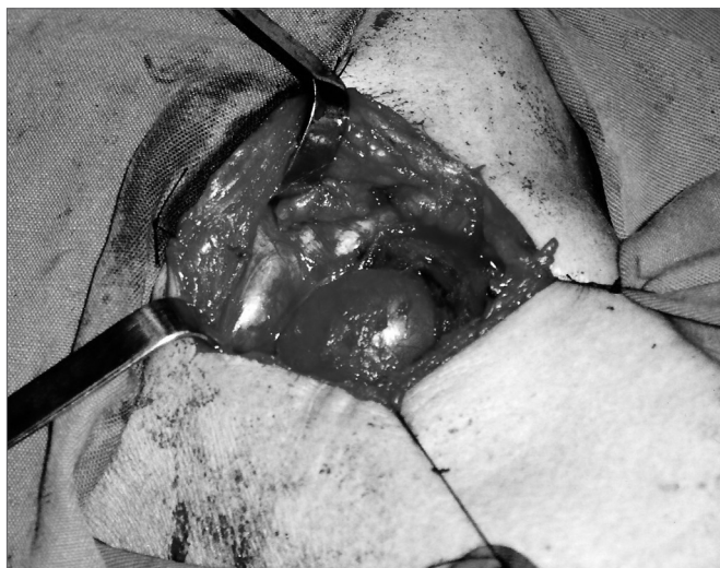
Figura 5. Ressecção da lesão por via externa.