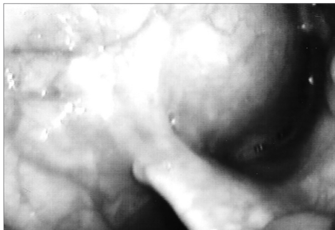
Figura 2. Parte interna da laringocele. Videolaringoscopia mostrando tumoração ocluindo o vestibulo laríngeo, com apagamento do seio piriforme.