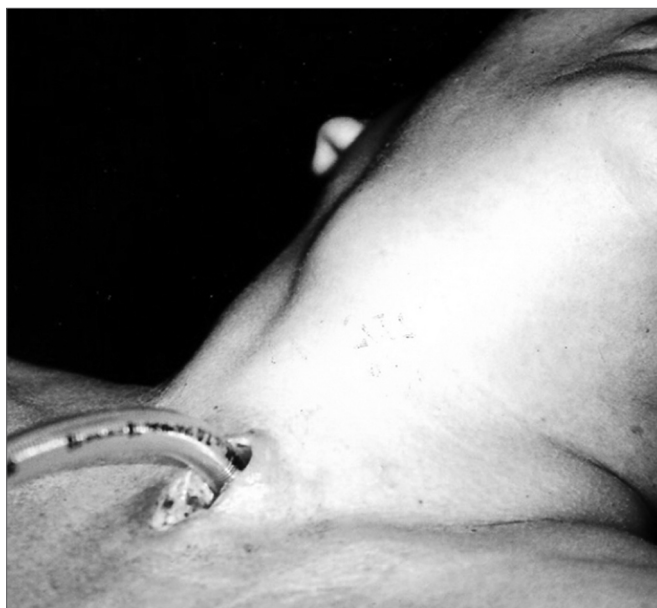
Figura 1. Parte externa da laringocele. Notar massa cervical à direita. Nesse momento, já traqueostomizada.

Paciente feminina, 45 anos, do lar, atendida em maio de 2002 com queixa de disфонia há aproximadamente 40 dias associada a ronco. Negava tabagismo e doenças pulmonares ou laríngeas prévia. Ao exame físico, apresentava massa em região cervical direita (Figura 1) e ao exame laringoscópico mostrava presença de tumefação próxima a prega ventricular e prega ariepiglótica direita (Figura 2). Solicitada Tomografia Computadorizada (TC)