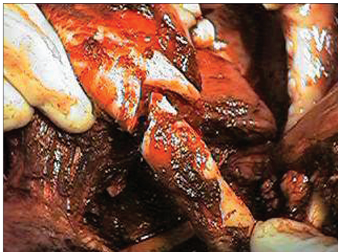
Figura 2. Osteossíntese mediante miniplacas de titânio.