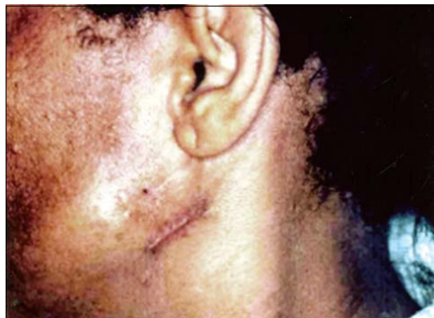
Figura 2. Pequena tumoração na região parotídea (3ª lesão). Também podem ser observadas as cicatrizes cirúrgicas das lesões anteriores.