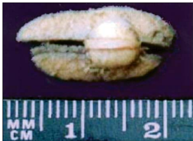
Figura 1. Aspecto do nódulo cutâneo retirado da derme na região submandibular (2ª lesão).

Para um tumor com diferenciação apócrina, localizado na parótida, podem ser consideradas as seguintes hipóteses para o diagnóstico diferencial: 1) metástase de carcinoma ductal de mama, devido à presença de diferenciação apócrina que pode ocorrer neste tumor, além do fato de a mama ser uma sede freqüente de tumor primário com situação anatômica infraclavicular gerando metástase para a parótida 7,8 ; 2) metástase de carcinoma apócrino cutâneo, que possui